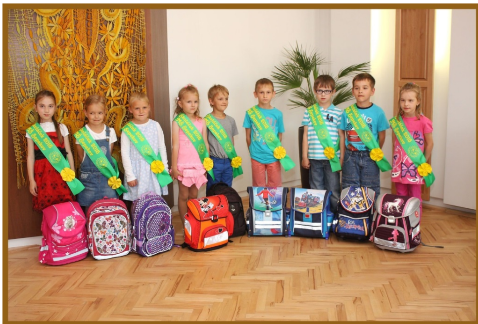
Na fotografii zleva:

Po nezbytném a pro někoho i vyčerpávajícím focení vykročili již budoucí prvňáčci na cestu do školních lavic.