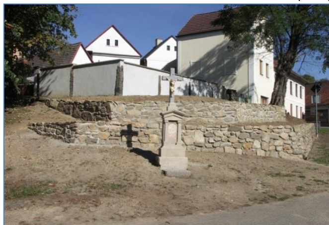
Stav po proměně