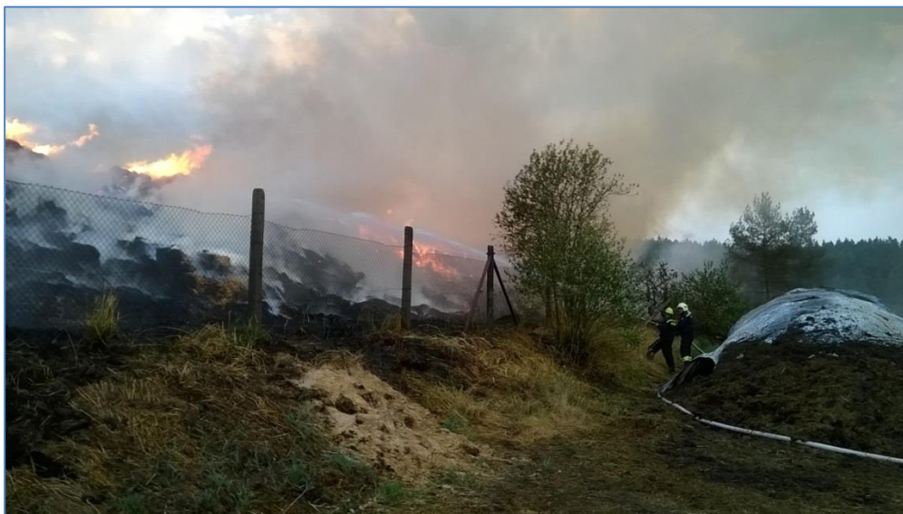
Požár stohu v Božeticích