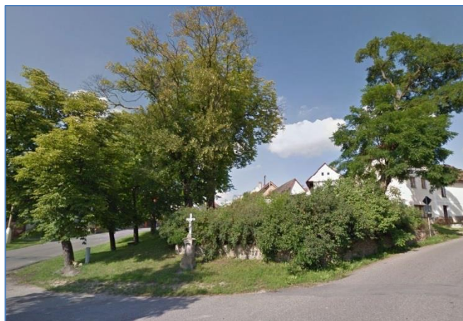
Stav před proměnou