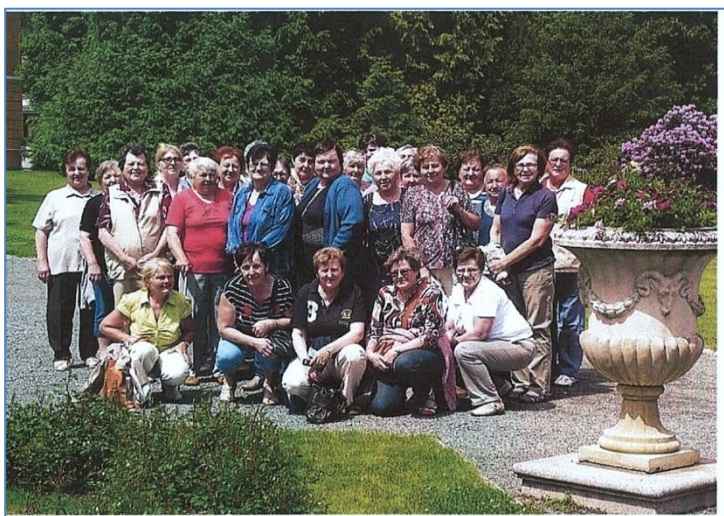
Společné foto na státním zámku Kozel