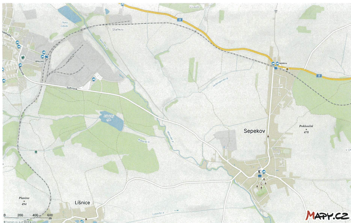
Líšnický rybník zvaný koupaliště Pytlák 1 km východně od Sepekova