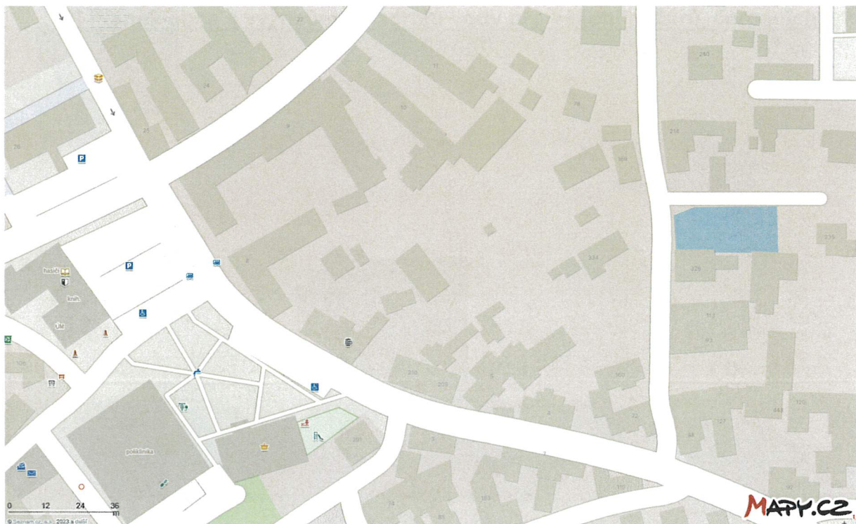
Požární nádrž Rybníček, lokalita „Za humny“ v Sepekově