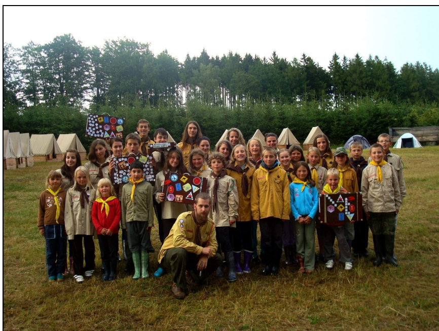
(fotografie z letošního tábora u Chlístova)

Chceš-li se k nám přidat, neváhej a klidně přijď!!!