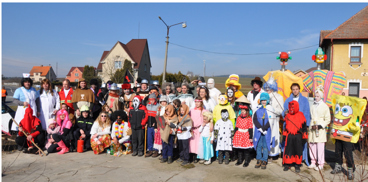
Společné foto účastníků maškarního průvodu v letošním roce

Maškarní průvody v Sepekově obnovil v roce 2010 „Spolek nadšenců Sepekova“ a patří mu za to velké poděkování.